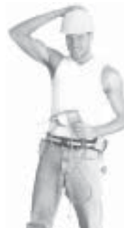
...och jag gör grovjobbet.

Detta är relevant för den feministiska och homosexuella frigörelsekampen eftersom det mesta av förtrycket mot oss som homosexuella sker på en ideologisk nivå, inte ekonomiskt. Detta gäller i högre grad för bögar än flator. Kvinnoförtrycket tar sig övervägande ekonomiska uttryck, vilket teoretiserandet av det obetalda hushållsarbetet har försökt påvisa. Men det finns också en ökande medvetenhet om att frågor om kön och sexualitet inte på något enkelt sätt kan förklaras med hänvisningar till kapitalismen. Ur detta växer den senaste tidens debatt om patriarkatet och kopplingarna mellan kapitalism och patriarkat.