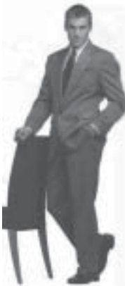
-Jag investerar i maskulinitet.

mänskligt handlande. Detta bäddar för passivitet och reformism. Även när aktivism betonas kan dock teorin fortfarande lida av ekonomism: om fokus sätts helt på ekonomin som den historiska förändringens motor kan kampen förstås bara i ekonomiska termer. Arbetarnas kamp är inte begränsad till en strävan efter högre lön och bättre arbetsförhållanden. Arbetarens position är också resultatet av en social struktur som börjar präglas in genom familjen och förstärks av en borgerlig ideologi. De könsroller som definieras i familjen är centrala för arbetsdelningens uppdelning i manligt och kvinnligt. Ekonomismen blundar för hela den dynamiken och påstår att de sociala relationerna kommer att förändras av sig själva efter revolutionen. Erfarenheterna från de "socialistiska" regimerna världen över pekar mot att detta inte är fallet. Statligt övertagande av produktionsmedlen, om än utan arbetar-demokrati, har genomförts, men familje-ideologin och de sociala relationer den ger upphov till förblir liknande dem i västerländska kapitalistiska länder.