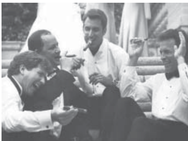
-Ha ha!! -Gick de på det där om klass och sexualitet!