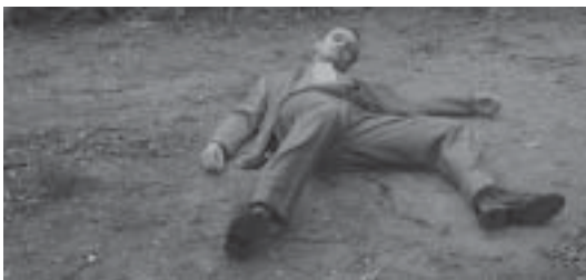
golvad av queer-kommunismen